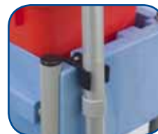
Haken voor accessoires

De trays zijn zo ontworpen dat er verschillende haken en klemmen aan kunnen worden bevestigd.