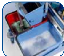
17 liter emmers