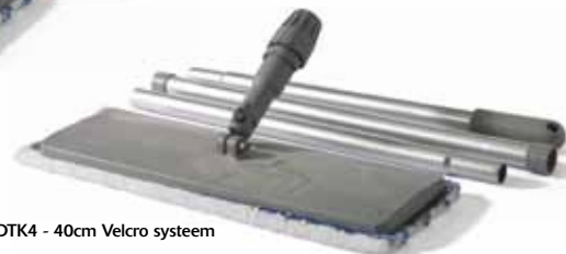
DTK4 - 40cm Velcro systeem