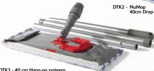
DTK3 - 40 cm Hang-on systeem