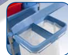
120L of 2x 70L afvalzakhouder