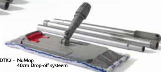
DTK2 - NuMop 40cm Drop-off systeem