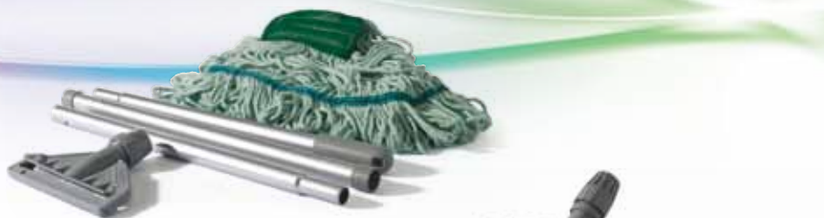
DTK1 - Monsoon Kentucky Mop kit